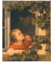
G. F. Kersting: Kinder am offenen Fenster

Das Museum der Barlachstadt Güstrow, gegründet im Jahre 1892, zählt heute zu den bedeutenden kulturhistorischen Museen des Landes Mecklenburg-Vorpommern. Auf 500 m 2 Ausstellungsfläche dokumentiert es die Geschichte, Kunst und Kultur der Barlachstadt Güstrow. Großaufnahmen historischer Bildvorlagen und computergestützte Medien verstärken den visuellen Eindruck der Ausstellung.